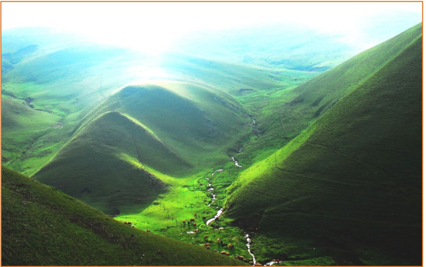
封二图片