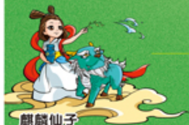
麒麟仙子 曲靖市文明小天使